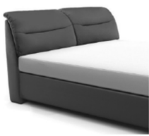
0848 Höhe ca. 112 cm