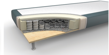
modern Höhe: ca. 15 cm