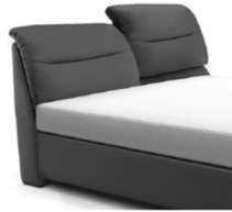
0848 KV Höhe ca. 112-123 cm