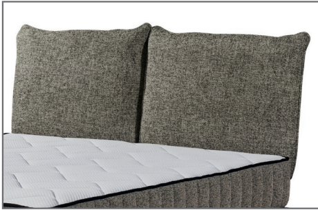
Kopfteil Baldwin A zweigeteilt, Kissenform