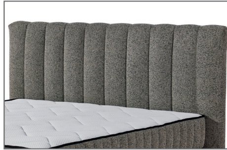
Kopfteil Baldwin B Streifensteppung