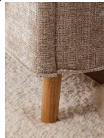
Holzfuß massiv, eichefarbig