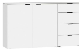
Kommode Typ 18