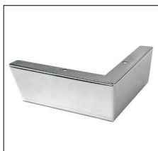
C 250 (H 6,5 cm) Chrom