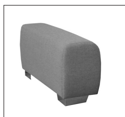
Armlehne „B“ Breite: ca. 30 cm