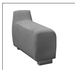
Armlehne „A“ Breite: ca. 30 cm

Achtung: Die Armlehnen sind nicht zum Sitzen geeignet. Die maximale Belastbarkeit beträgt ca. 25 kg.