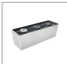
KC 17 (H 6,5 cm) Kunststoff-Chrom