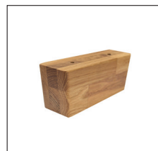
H 256 (H 6,5 cm) Eiche 400, geölt