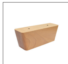
H 155 (H 6,5 cm) Buche: – natur Nr. 108 – wenge Nr. 119 – schwarz Nr. 250 – silber Nr. 260