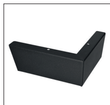
S 250 (H 6,5 cm) Metall, Schwarz pulverbeschichtet