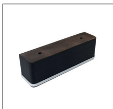
HM 120 (H 6,5 cm) – Buche natur Nr. 108 / Metall – Buche wenge Nr. 119 / Metall – Buche schwarz Nr. 250 / Metall