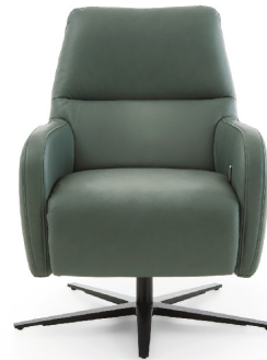
1D - Rücken niedrig ohne Kopfpolsterverstellung