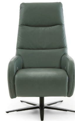
1DKV - Rücken hoch inkl. Kopfpolsterverstellung

Bitte alle erforderlichen Vorgaben zu einer Bestellung beachten. Beginnen Sie Ihre Angaben mit der davorstehend linken Type. (Bitte Stellskizze mitsenden)