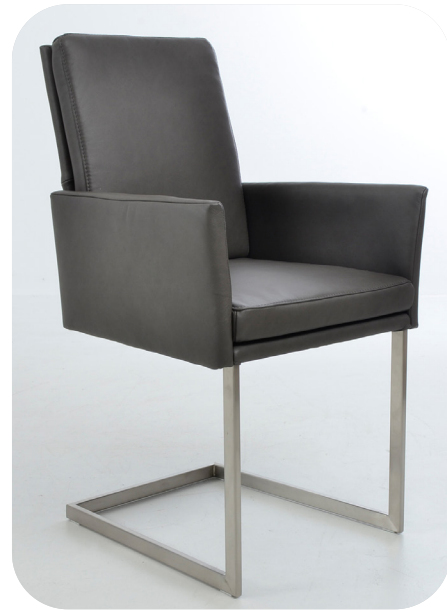
1B Freischwinger-Sessel Edelstahl optik gebürstet