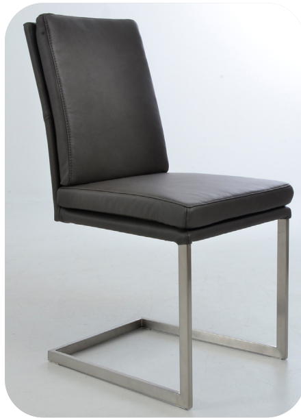
1A Freischwinger Edelstahl optik gebürstet